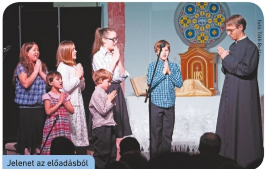
Jelenet az előadásból